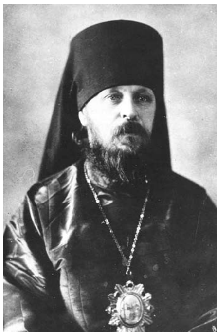
Священноисповедник Виктор (отошел ко Господу в 1937 году в с. Нерица Усть-Илемского района)

(Свт. Феофан Затворник. Мысли на каждый день года.)